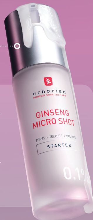
GINSENG MICRO SHOT STARTER 0.1 % PPI*: 53.10 CHF 30 ml