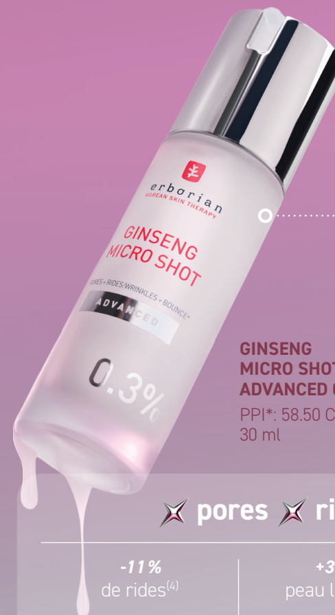
GINSENG MICRO SHOT ADVANCED 0.3 % PPI*: 58.50 CHF 30 ml

* PPI: Prix public indicatif. Les prix de vente sont fixés librement par le revendeur.